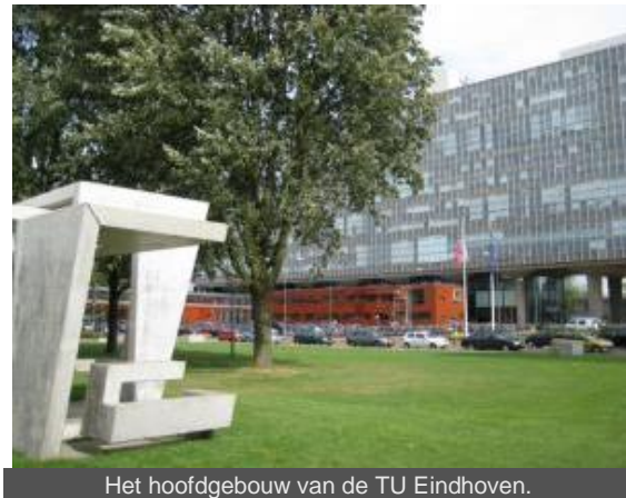
Het hoofdgebouw van de TU Eindhoven.

De Technische Universiteit Eindhoven TU/e publiceert van alle universiteiten op de wereld de meeste wetenschappelijke onderzoeksresultaten in samenwerking met het bedrijfsleven.